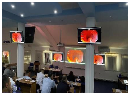
Figura 1. Transmetim i drejtpërdrejtë i endoskopive nga Kabineti i Endoskopisë, i Klinikës së Gastroenterologjisë

Përveç bashkëpunimit ndërkombëtar, njësitë organizative të SHSKUK-së, Fakulteti i Mjekësisë, Shoqata Profesionale OMK, organizata studentore, OJQ etj., kanë përdorur dhe vazhdojnë të shfrytëzojnë në mënyrë aktive infrastrukturën e QKTK-së për të organizuar aktivitete edukative në fushën e mjekësisë.