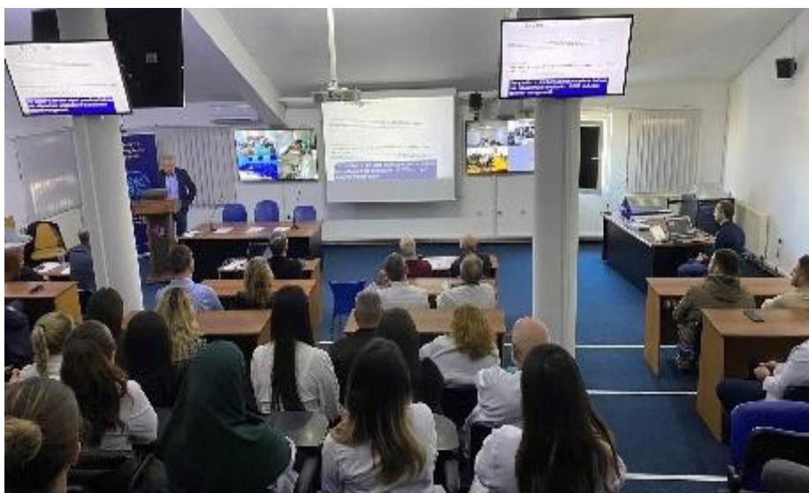
Figura 2. Ligjërata me temë nga Kirurgjia, të transmetuara në Qendrat Rajonale të Telemjekësisë

Romë, Itali, IVEH dhe strategjia e saj IBOT nderohet, në mesin e mbi 1000 të përzgjedhurve, me çmimin International Health Promotion Award; (për më shumë vizito www.iveh.org );