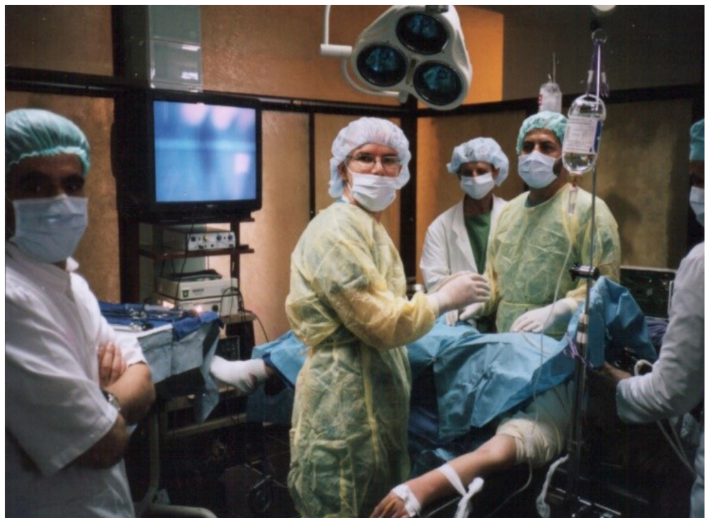
Figura 1. Gjatë LPSC në vitin 2001